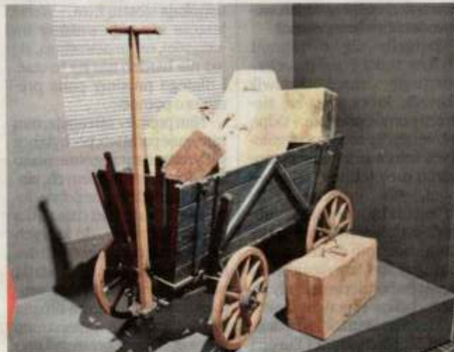
Pamiątki przesiedleńców, którzy w Zielonej Górze znaleźli swój drugi dom - swoją nową małą ojczyznę