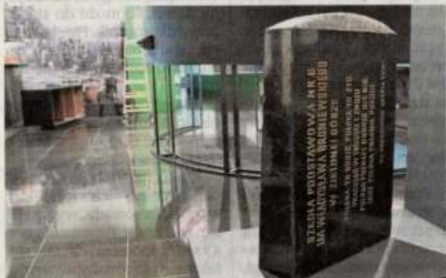
... a tu ta sama płyta nagrobna, ale z drugiej strony - kiedy po wojnie przez lata ekspozowana była w polskiej szkole