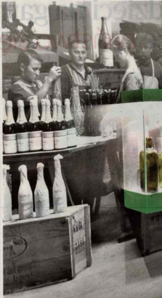
Powiększone archiwalne fotografie dają złudzenie, iż pracownicy winiarni sprzed stu lat zaraz wyjdą do nas z butelką w rękę