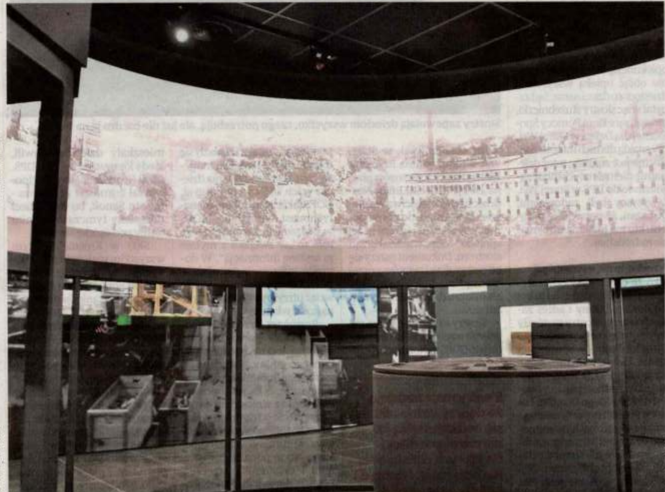
„Ślimak” - mocno powiększona, podświetlona panorama miasta Emila Bergrera z końca XIX w. Wchodząc do środka, będziemy „wędrować” od domku winiarskiego na ul. Ceglanej, zobaczymy Wieżę Braniborską, Pałacyk Schneidera, fabrykę Förstera...