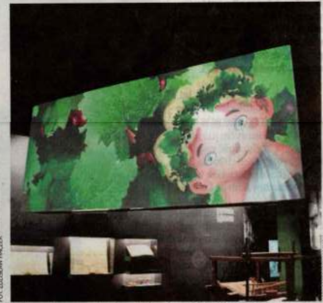
Nad ruchomą makieta, na której wyświetlają się mapy regionu, dokazuje sympatyczny Bachusik