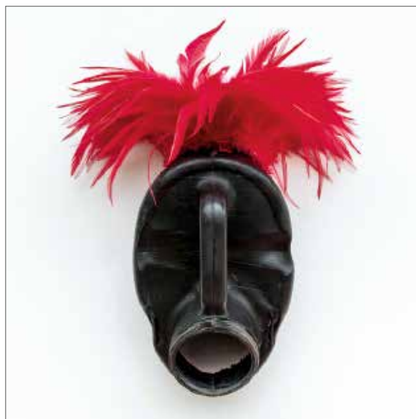
Romuald Hazoumè, Afriquoi , 2022