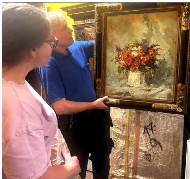
Pracownicy Muzeum podczas rozpakowywania kolekcji

monumentalne przedstawienie widoku miasteczka w ujęciu z miejscowego ratusza. W rok po monograficznej wystawie do Działu Sztuki Dawnej zielonogórskiego Muzeum trafił obraz Św. Genowefa , dar Eckarda Sterna.