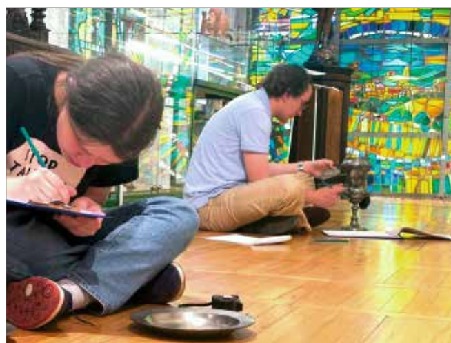
Studenci inwentaryzowali m.in. inskrypcje na naczyniach Działu Winiarskiego