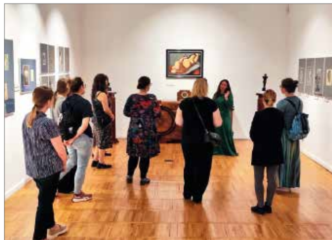
Oprowadzanie kuratorskie z elementami improwizacji ruchowej

Połączenie swobodnego gestu z wyrazistym tańcem pozwoliło w ciekawy sposób dotrzeć do kwintesencji stylu art