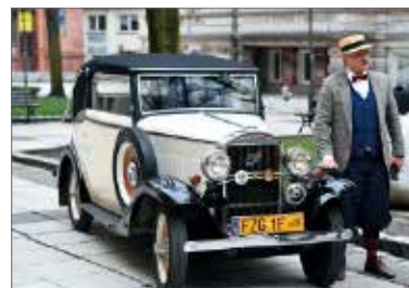
Członkowie grupy Retro Lubuskie podczas wernisażu

Tytuł: Lata 20., lata 30. Kolekcja art déco ze zbiorów Muzeum Mazowieckiego w Płocku