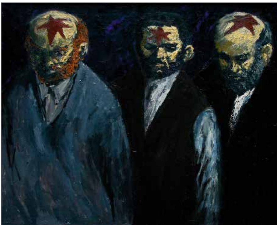
Marek Oberländer, Napiętnowani, olej, płótno, 80x100, 1955