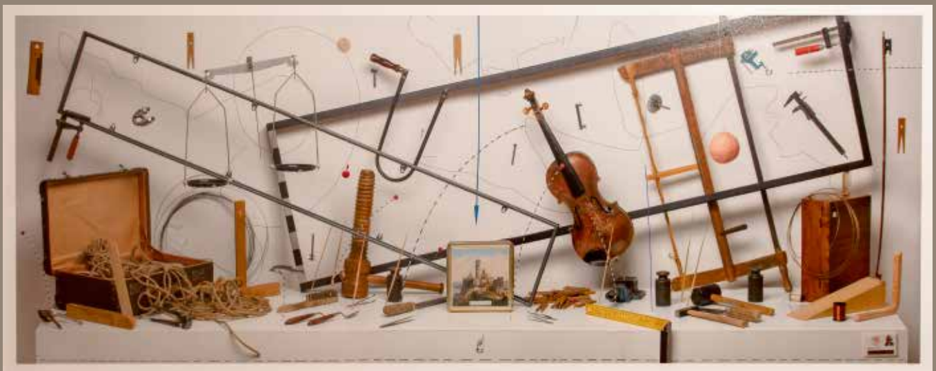
Pudelko po pralinkach z cyklu Covid, 2020-2021, fotografia, druk cyfrowy, dibond, 66 x 169 cm