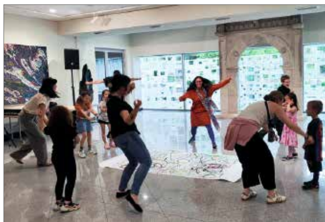
Młodzi uczestnicy warsztatów w ruchu i tańcu