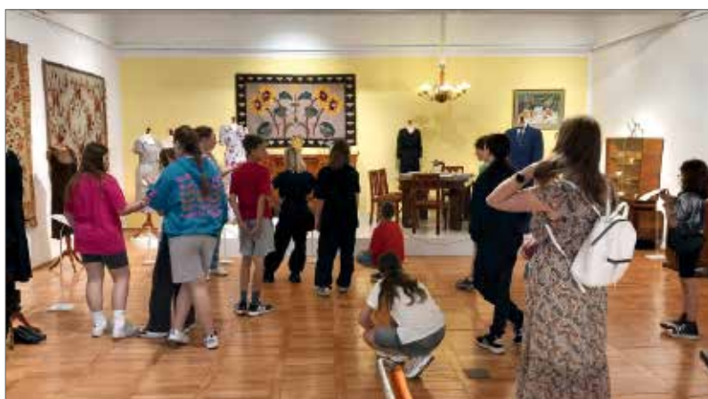
Grupa uczestników warsztatów podczas zwiedzania wystawy