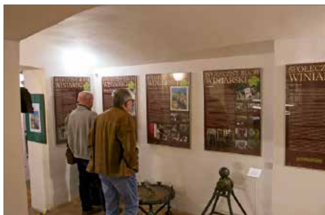
Fragment ekspozycji w Muzeum Wina

spacery, konferencje, panele dyskusyjne, targi, szkolenia, zwiedzanie winnic, promocje książek i wernisaże.