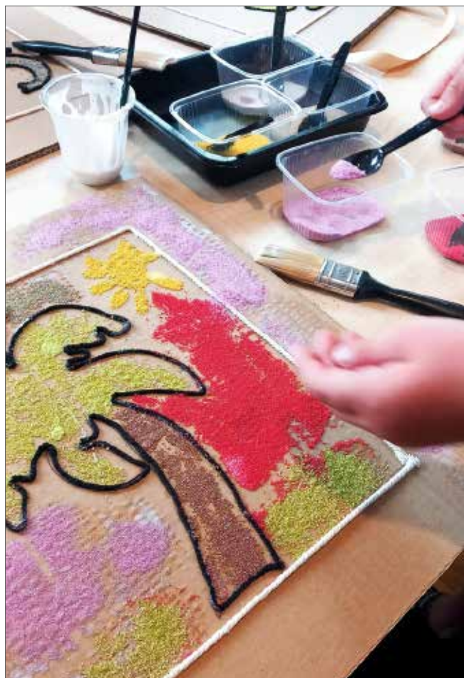
Prace plastyczne z wykorzystaniem barwionego piasku

Realizacja warsztatów wymagała przygotowania specjalnych materiałów: kolorowego piasku, farb akrylowych, podkładów tekturowych, kleju, nożyczek, szablonów i pędzli, co zostało ujęte w planie organizacyjnym zadania. Natomiast relacje fotograficzne z zajęć oraz szczegółowe informacje o Akcji Lato '25 w MZL można było znaleźć na stronie internetowej Muzeum ( www.mzl.zgora.pl ) oraz na profilu Facebook: Edukacja w muzeum.