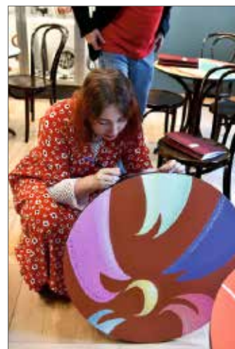
Autorki składają podpisy przy swoich pracach