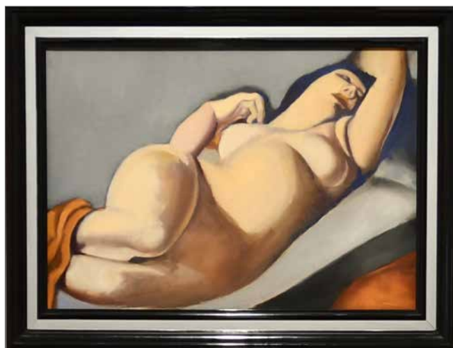
Tamara Łempicka, Piękna Rafaela III , ze zbiorów Muzeum Narodowego w Lublinie