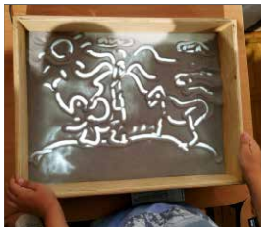
Kompozycje piaskowe na podświetlanych ekranach

Tytuł: Afryka – mój dom . Prace młodzieży z krajów Afryki ze zbiorów Galerii i Ośrodka Plastycznej Twórczości Dziecka w Toruniu Czas trwania: 17 V – 27 VII 2025