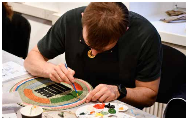
Warsztaty plastyczne przyciągnęły wielu zwiedzających w różnym wieku