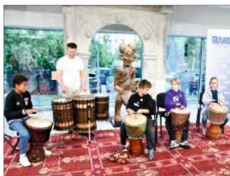
Chętnych do wspólnego muzykowania nie brakowało