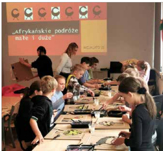
Warsztaty w afrykańskim klimacie