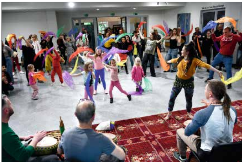
Podczas warsztatów tanecznych