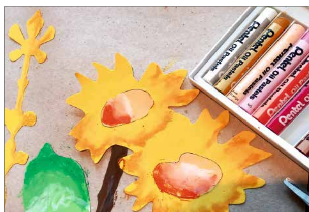
Prace plastyczne inspirowane kilimem ze słonecznikami