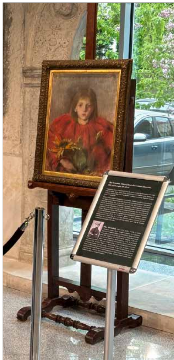
Prezentacja obrazu Olgi Boznańskiej Dziewczynka ze słonecznikami w muzealnym holu

Oprócz możliwości obejrzenia samej Dziewczynki ze słonecznikami , muzealni goście zyskali możliwość nabycia najnowszego, bogato ilustrowanego wydawnictwa poświęconego malarce pt. Olga Boznańska. Malarka ludzkich dusz (wydawnictwo SBM, Warszawa 2024), dostępnego w naszej muzealnej księgarni.