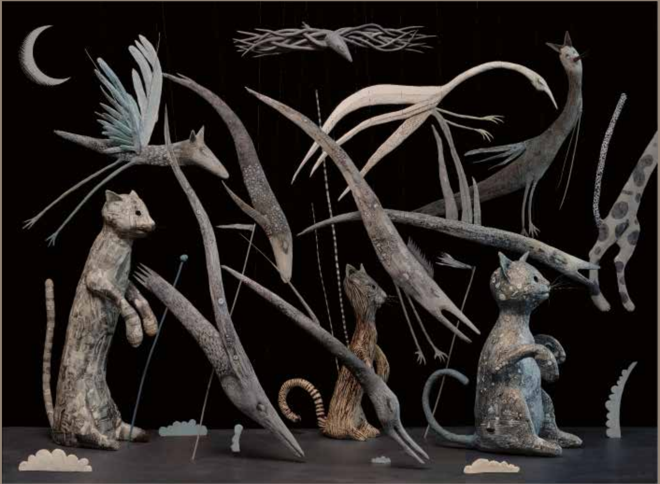
Elizjum, 2024-2025, fotografia, druk cyfrowy, dibond, 113 x 153 cm