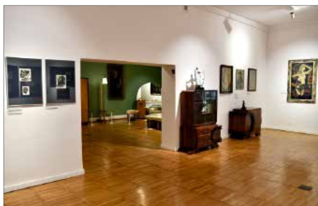
Aranżacja wnętrza z kompletami salonowych mebli w stylu art déco