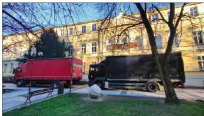
Wystawa przyjechała z Muzeum Mazowieckiego w Płocku

narodowy charakter. Powstałe po blisko 120 latach niewoli państwo polskie w sposób szczególny identyfikowało się ze sztuką tego okresu. Inspiracją były między innymi motywy zaczerpnięte z rodzimej kultury ludowej, widoczne w sztuce, rzemiośle i wyrobach przemysłowych. Inauguracja ekspozycji zbiegła się z setną rocznicą otwarcia Międzynarodowej Wystawy Sztuki Dekoracyjnej i Wzornictwa w Paryżu, gdzie polscy artyści odnieśli wielki sukces, zdobywając wiele nagród.