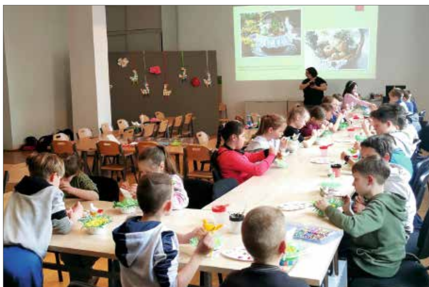
Uczestnicy warsztatów podczas zajęć