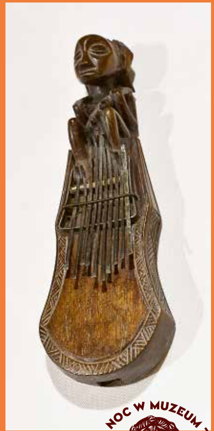
Eksponaty z wystawy Skarby Czarnego Lądu, ze zbioru Działu kultur Pozaeuropejskich Muzeum Narodowego w Szczecinie