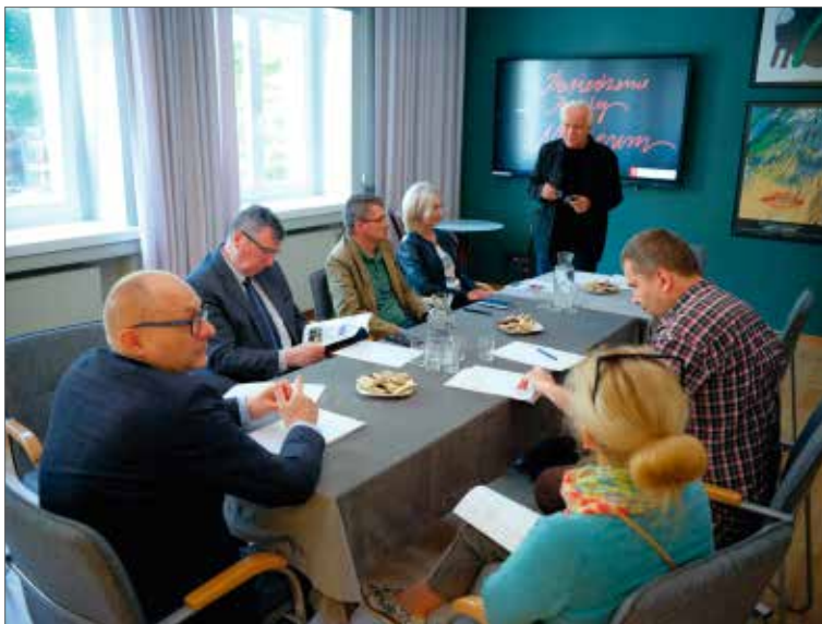
Członkowie Rady Muzeum Ziemi Lubuskiej podczas posiedzenia