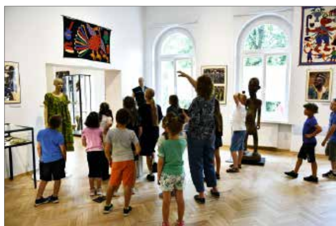
Podczas zajęć w Muzeum zwiedzanie wystawy Skarby Czarnego Lądu

W ramach warsztatów dzieci odwiedziły trzy wystawy czasowe: