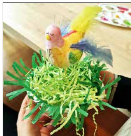
Efekty twórczej pracy